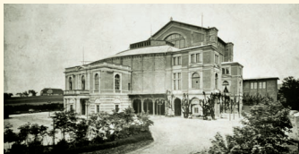
Das Bayreuther Festspielhaus von 1899