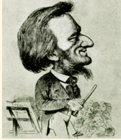
Richard Wagner als Jude, Wien 1873

Historisierung der Person Richard Wagners an, die von der Einbettung seines Lebens und Schaffens in den zeitgenössischen deutschen politischen Kontext ausgeht. Damit wird der Maßstab gewonnen, den Komponisten in seiner Zeit und in den Bezügen zu seiner Umwelt zu verstehen. Das schließt in der exakten Rekonstruktion ein, um die komplizierte Persönlichkeitsstruktur Wagners – Bernd Weikl nennt sie multipel – keinen Bogen zu machen. Mittels einer kritischen Analyse der vorliegenden Wagnerliteratur legen die Autoren zudem zahlreiche neue Bezüge zum Schaffen Wagners offen.