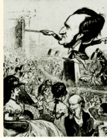
Wie es Wagner gefällt, das zahlende Judentum